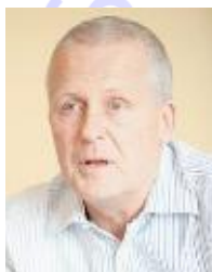
ALAIN CARDON - MCC.

Master Certified Coach por el ICF - International Coach Federation y una de las figuras de mayor reconocimiento internacional y referencia en materia de Coaching Sistémico y Organizacional; autor de numerosas publicaciones y libros, entre estos destacamos el aclamado libro "Le Coaching d'Équipes". Alain Cardon inspira y dirige a Metasystème, organización totalmente orientada a resultados, red de coaching de equipo y organizacional radicalmente dedicada a incrementar el éxito medible a través del avance de las estrategias sistémicas. Alain Cardon forma y supervisa coaches en Francia, Bélgica, Rumanía y España.